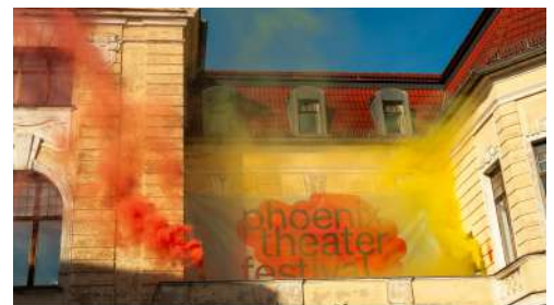
Phoenix 2.0 Festivalöffnung