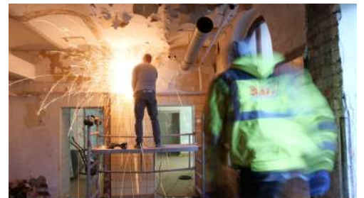
Umbau KulturQuartier Schauspielhaus Entkernungs- und Abbrucharbeiten im Keller