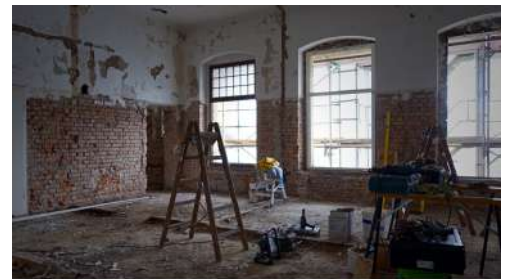
Umbau KulturQuartier Schauspielhaus Abbruch der Toiletten im Erdgeschoss