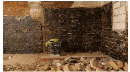
Umbau KulturQuartier Schauspielhaus Abbrucharbeiten im Kellergeschoss