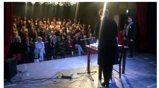
Sommer in Rose N. Gorminger – Ich bin doch nicht hier, um Sie zu amüsieren