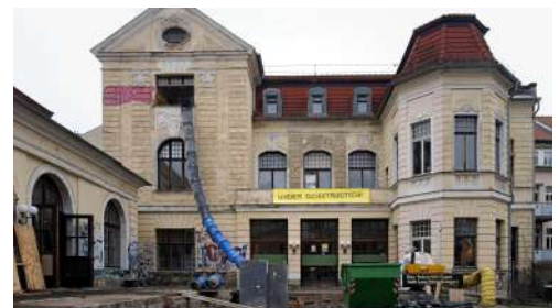
Umbau KulturQuartier Schauspielhaus Abbrucharbeiten 2. Obergeschoss