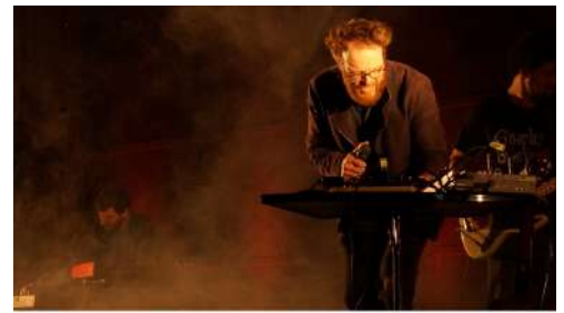
Preview Vol. 2 The DD Affair

Die stetig wachsende Zahl der Mitgliedschaften in der Genossenschaft zeigt, wie groß der Wille zur Unterstützung der Idee eines KulturQuartiers im Schauspielhaus ist.