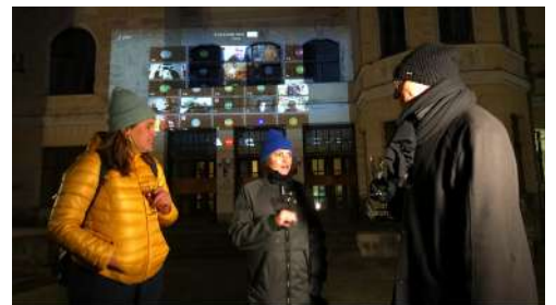
„Jippie, wir haben das Schauspielhaus gekauft!“