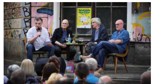
Sommer in Rose Tafelrunde ohne Ritter [Eine Gralssuche in drei Akten] © Boris Hajduković