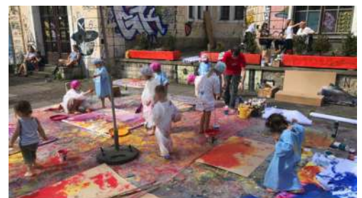
KulturQuartierFestival Kindertag im Schauspielhaus