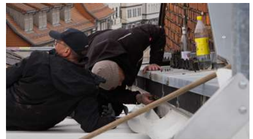
Umbau KulturQuartier Schauspielhaus Arbeiten am Dach