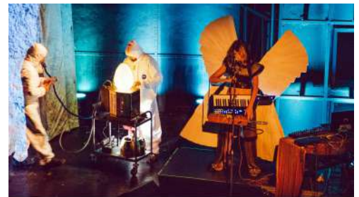
KulturQuartierFestival RimōJeki - The TopheT Show © Franky Siegler