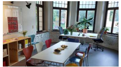
Projektbüro im Erkerzimmer

Die Fertigstellung des Umbaus und der Sanierungsmaßnahmen ist für Ende 2026 geplant.