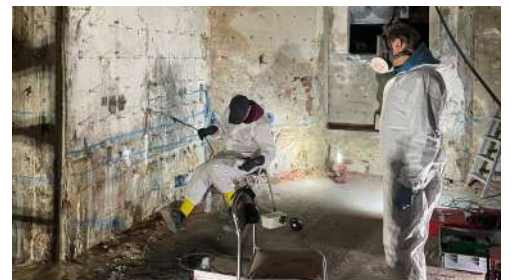
Umbau KulturQuartier Schauspielhaus Injektionsdichtungsarbeiten im Kellergeschoss