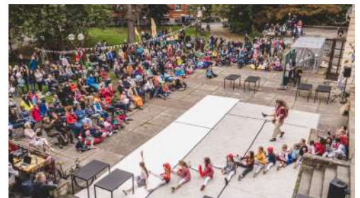
KulturQuartierFestival Tanztheater Erfurt - Momo