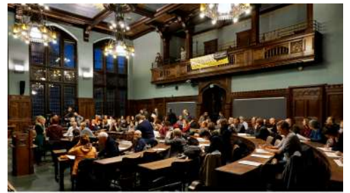
Gründung der Genossenschaft

Bekräftigt durch den großen Zuspruch der in Erfurt lebenden Menschen entschied der Verein, die Idee zur Entwicklung eines KulturQuartiers an einem anderen Ort weiterzuverfolgen und ist auf das Schauspielhaus Erfurt gestoßen, das zu dieser Zeit seit mehr als 10 Jahren leer stand.