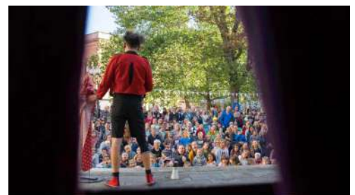
Preview Vol. 5 Kaosclown – Kids Deluxe